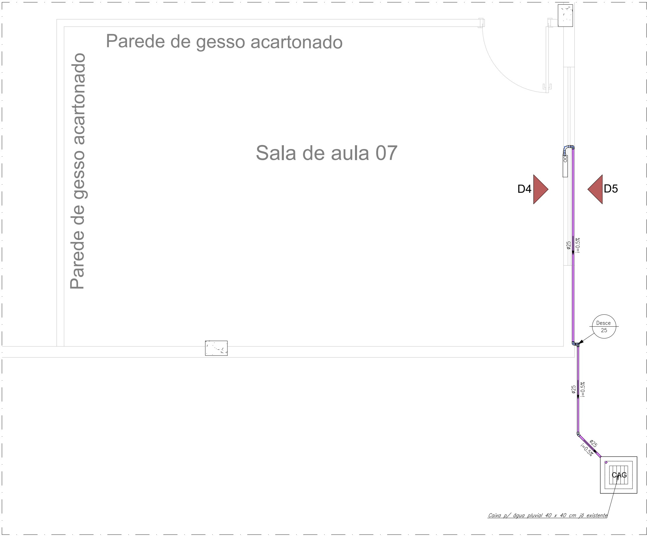
02 DETALHE DRENAGEM - SALA 07 ESCALA: 1/30